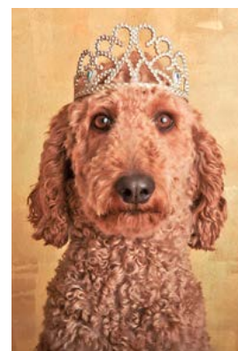
Die heimliche Königin in Bundesbern: LilyBelle.

nur dank ihrer langbeinigen Anmut und den apricot-goldenen Locken, ihr Besitzer Charly Hug geht seit 30 Jahren als Fotograf im Berner Bundeshaus ein und aus. Dort haben Hunde zwar keinen Zutritt, wenn er aber für eine Homestory einen Parlamentarier besucht, wird LilyBelle jeweils herzlich willkom-