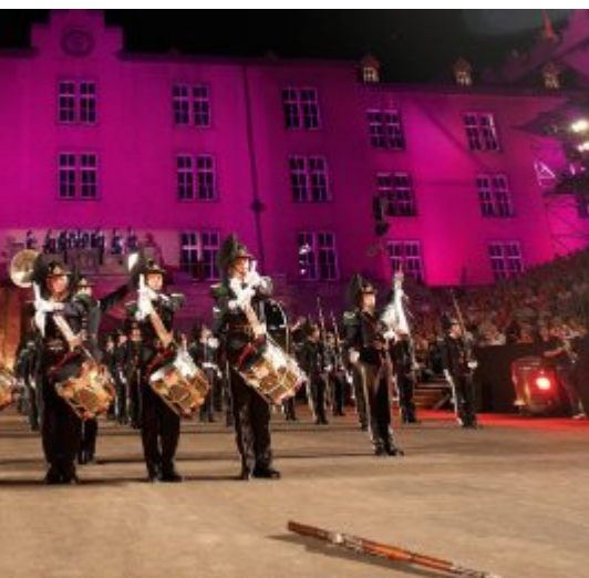
Norwegen war schon beim ersten Basel Tattoo dabei. une formation déjà de la partie lors du premier Basel Tattoo. gia era presente anche alla prima edizione del Basel Tattoo.

Mit The Band of The King's Division ist auch das britische Königshaus am Basel Tattoo 2017 vertreten. Die 1968 gegründete Formation ist eine von drei professionellen Brass Bands der britischen Armee. Sie blickt auf eine lange Geschichte zurück und gehört mittler-