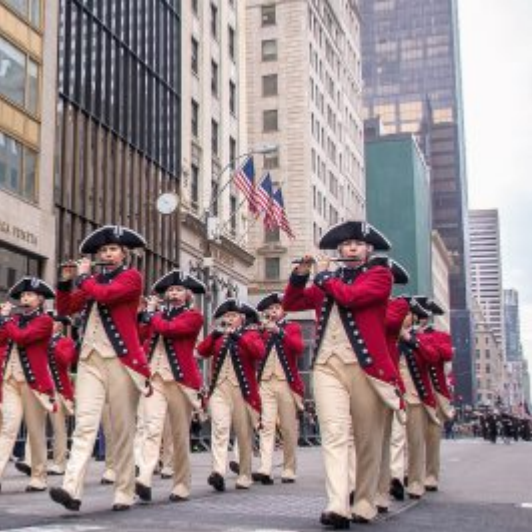
Drum Corps au Basel Tattoo 2017. Drum Corps au Basel Tattoo 2017. Drum Corps au Basel Tattoo 2017.

die Besucher des Basel Tattoo mit einer eindrücklichen Vorstellung überzeugen.