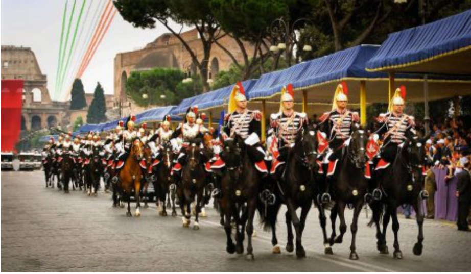
Am Tattoo 2017 werden die italienischen Corazzieri auf Pferden und Motorrädern zu bestaunen sein. Lors du Tattoo 2017, les Corazzieri italiens se produiront à cheval et sur leurs motorcycles. Al Tattoo 2017, gli spettatori potranno ammirare i Corazzieri italiani montare cavalli e moto.

bis hin zu klassischer Marschmusik. Ihre Auftritte sind erfrischend, sympathisch und äusserst spektakulär. Die Australier bieten beste Unterhaltung. Wo sie auftreten lösen sie Begeisterungstürme aus. Das Publikum hält es kaum auf den Sitzen. Mit auf ihre Reise nehmen sie auch eine neu zusammengestellte Show mit vielen musikalischen Überraschungen.