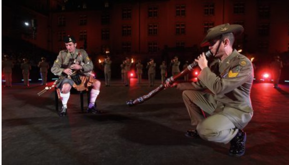
Unterhaltung aus Down Under: Die Australian Army Band. Divertissement en droite ligne des antipodes: l'Australian Army Band. Intrattenimento da Down Under: l'Australian Army Band.

cront assurément aussi le public du Basel Tattoo par leurs impressionnantes évolutions.