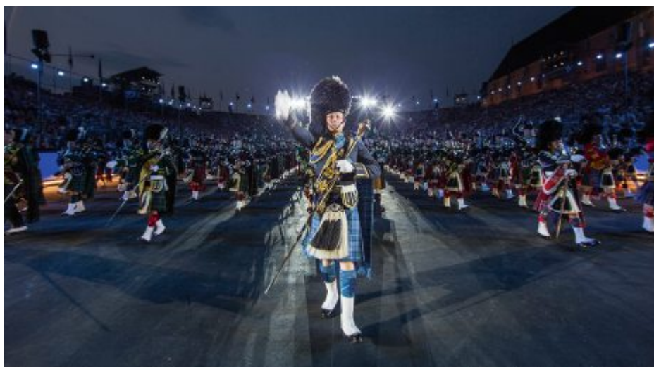
Kein Tattoo ohne die imposanten Mased Pipes and Drums. Pas de tattoo sans l'imposante formation de Mased Pipes and Drums. Non c'è Tattoo senza gli imponenti Mased Pipes and Drums.

ti di questa arte sportiva. Nella loro patria sono una formazione di culto e sapranno convincere anche il pubblico del Basel Tattoo con uno spettacolo impressionante.