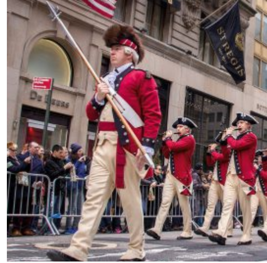
Das United States Army Old Guard Fife and Drum Corps kommt zum ersten Mal zum Tattoo 2017. Erste Schweizer Premiere für das United States Army Old Guard Fife and Drum Corps.

menti e alle sue uniformi, porterà una buona dose di allegria e di spontaneità. Il suo repertorio si estende dal rock al pop, senza dimenticare la musica da marcia più classica. Le sue esibizioni sono fresche, simpatiche e soprattutto spettacolari. Gli Australiani offrono il migliore intrattenimento. Ovunque si esibiscono, sollevano ondate di entusiasmo. Il pubblico non potrà stare fermo sulla sedia. Nella loro esibizione presenteranno uno spettacolo totalmente nuovo e ricco di sorprese musicali.