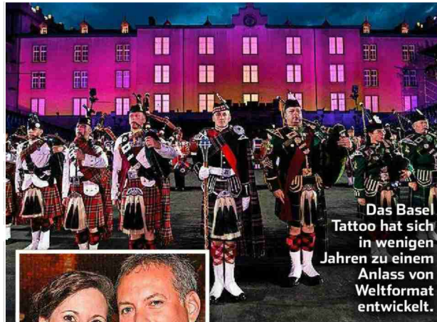
Das Basel Tattoo hat sich in wenigen Jahren zu einem Anlass von Weltformat entwickelt.